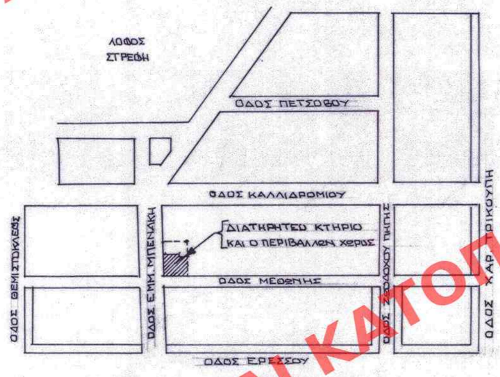
ΑΠΟΣΠΑΣΜΑ ΕΓΚΕΚΡΙΜΕΝΟΥ ΣΧΕΔΙΟΥ ΚΑΙΜ. 1:2000

ΥΠΟΥΡΓΕΙΟ ΠΕΡΙΒΑΛΛΟΝΤΟΣ ΧΩΡΟΤΑΞΙΑΣ & ΔΗΜΟΣΙΩΝ ΕΡΓΩΝ